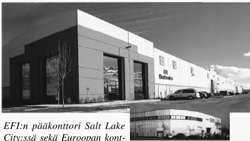
EFI:n pääkonttori Salt Lake City:ssä sekä Euroopan konttori Barcelonassa

Nykyään Efi Electronics:n tuotteet ovat käytössä erilaisissa teollisuuslaitoksissa ja rakennuksissa suojaamassa tietokoneita, ohjausjärjestelmiä, moottoreita ja muita sähköisiä laitteita. Yrityksellä on yli 200 patenttia.